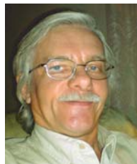
Andres Levald E-Konsult