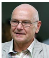
Ants Vasar Viru Keskus