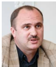
Ilmar Link Teede Projektijuhtimise AS