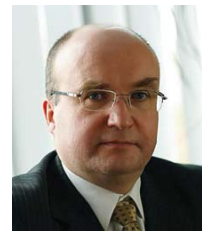
Tiit Roben Merko Ehitus