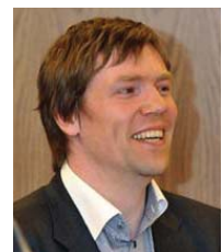
Mati Pops Citycon